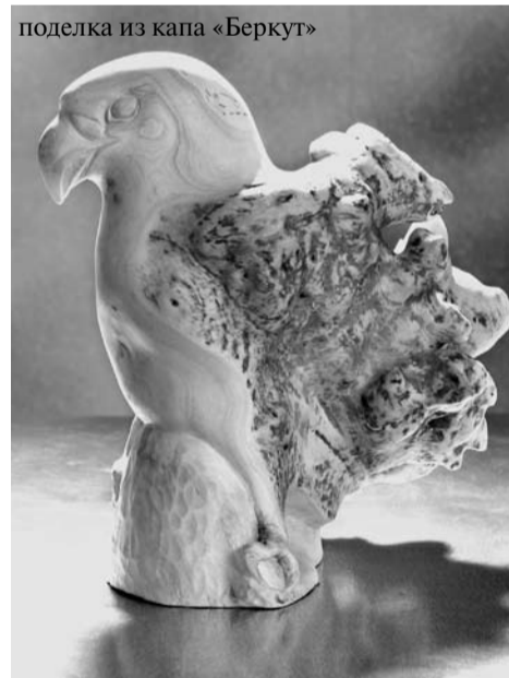
поделка из капа «Беркут»

Беседовал Андрей Филаретов.