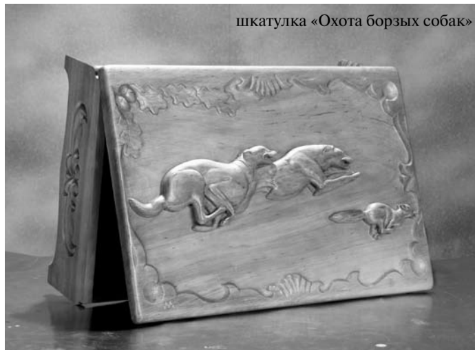
шкатулка «Охота борзых собак»